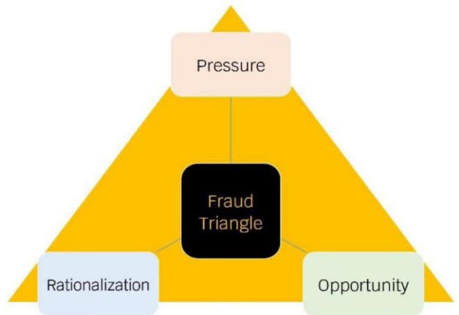
ทฤษฎี สามเหลี่ยมการทุจริต (Fraud Triangle)

องค์ประกอบหรือปัจจัยที่นำไปสู่ การทุจริต ประกอบด้วย Pressure/Incentive หรือแรงกดดันหรือแรงจูงใจ Opportunity หรือ โอกาสซึ่งเกิดจากช่องโหว่ของระบบต่าง ๆ คุณภาพการควบคุม กำกับควบคุมภายในของ องค์กรมีจุดอ่อน และ Rationalization หรือ การหาเหตุผลสนับสนุนการกระทำตามทฤษฎี สามเหลี่ยมการทุจริต (Fraud Triangle)